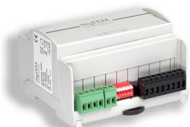
myTEM IO Modul Small MTIOS-100

Le IO Modul MTIOS-100 est un module universel de myTEM pour étendre votre système de maison intelligente avec des entrées et sorties supplémentaires. Pour ce faire, l'appareil est connecté à votre serveur central myTEM Smart Server via le système de bus CAN.