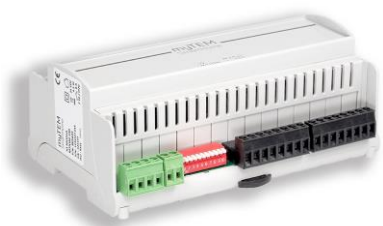
myTEM IO Modul MTIOM-100

Le IO Modul MTIOM-100 est un module universel de myTEM pour étendre votre système de maison intelligente avec des entrées et sorties supplémentaires. Pour ce faire, l'appareil est connecté à votre serveur central myTEM Smart Server via le système de bus CAN.